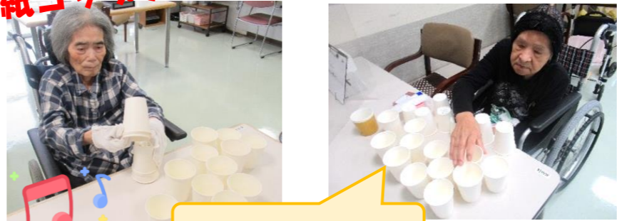
どれが点数高いかなー

10月19日に紙コップを使ったレクリエーションを行いました。時間制限の中、紙コップの裏に書いてある高い点数を狙い、ひっくり返され、点数を見て「うわー」と楽しんでおられました。