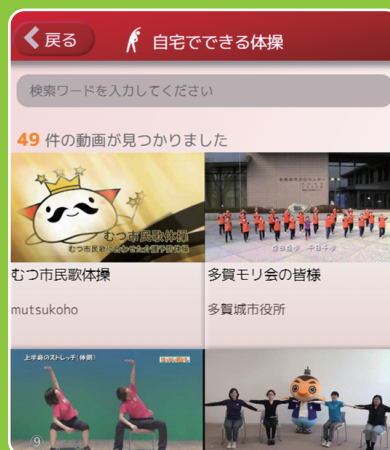
自宅で出来る体操動画 画面イメージ

適切な運動や活動を行うための フローチャートや運動・ 活動メニューを閲覧できます。