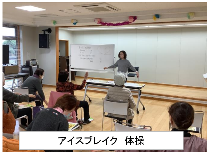
アイスブレイク 体操