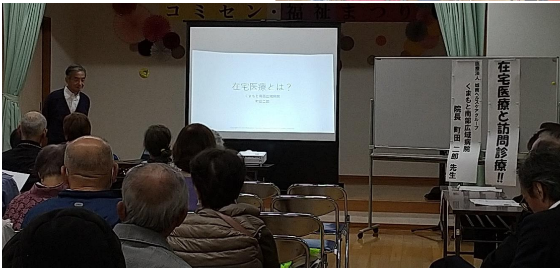
【在宅医療と訪問診療】 ・医療法人 城南ヘルスケアグループ