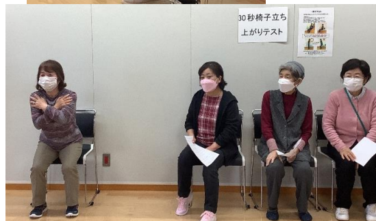
体力測定(握力・開眼片足立ち・ファンクショナルリーチテスト・Touch & Goテスト・30秒椅子立ち上がりテスト)