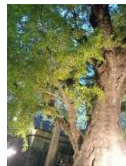
下田の大イチョウ