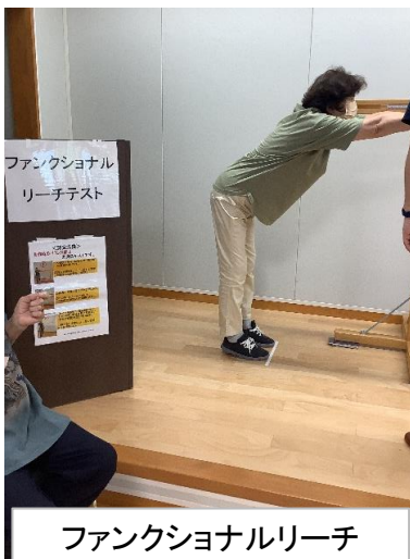
ファンクショナルリーチ