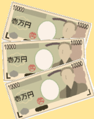
「電話で『お金』詐欺」認知件数(令和5年6月末)