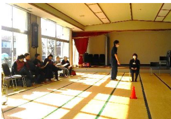
①体力測定に係る説明