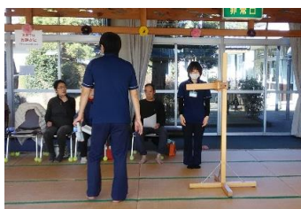
①体力測定に係る説明