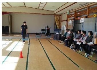
①体力測定に係る説明