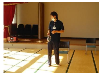
①体力測定に係る説明