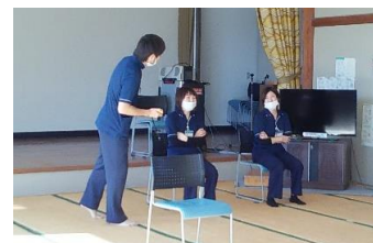
①体力測定に係る説明