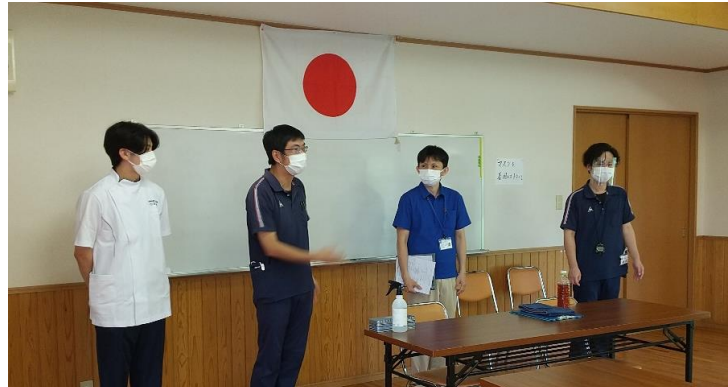
小林医療福祉グループ 桔梗苑(実習生) くまむた荘