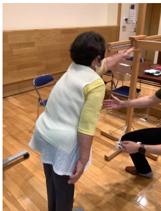
ファンクショナルリー