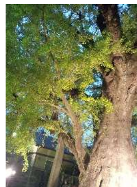
下田の大イチョウ