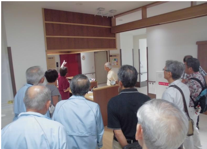
3F サービス付き高齢者向け住宅