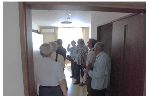
2F 小規模多機能 泊りスペース