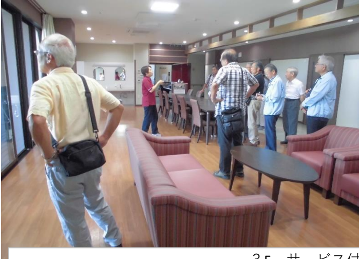
3F サービス付き高齢者向け住宅