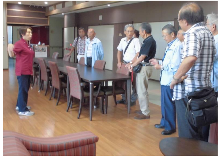
4F サービス付き高齢者向け住宅