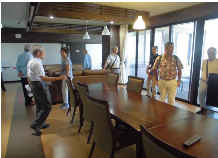
4F サービス付き高齢者向け住宅