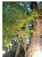
下田の大イチョウ