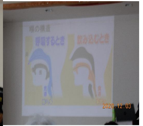
正月編 郷 美和子ST