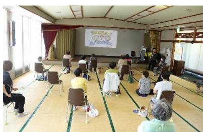
認知症予防について