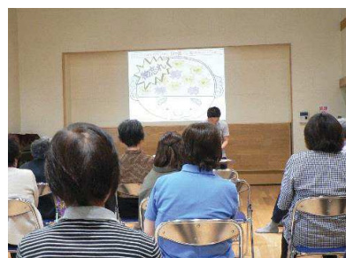
認知症予防について③