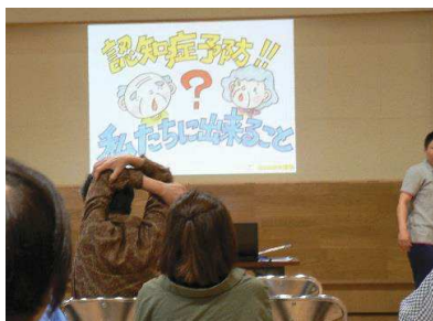
認知症予防について①