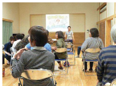
認知症予防について②