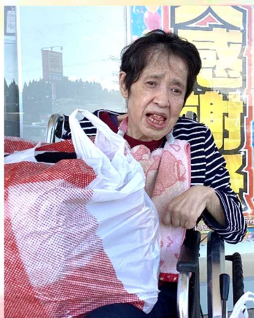
【寺田様】「しまむら」で可愛い洋服をたくさん買いました～♪