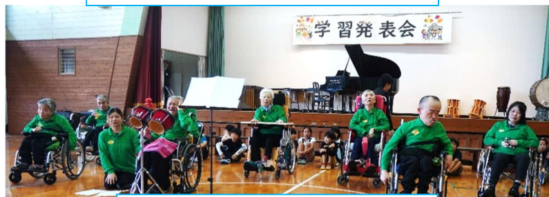
本番!!皆さん集中されています♪

11月9日、豊田小学校の学習発表会に音楽クラブの皆さんと参加してきました。6月より4年生の生徒さんと一緒に練習を重ねてきた「フラワー」と「星影のエール」2曲を演奏しました♪ 今年はお天気に恵まれ、待機時間もほかほか陽気で過ごすことが出来ました。本番を終え、「久々に緊張した」と話すご利用者や、「楽しかった」と笑顔のご利用者それぞれでしたが、これまでの取り組みの成果が十分に発揮できた素晴らしい演奏でした。また、来年に向けて練習を頑張ってくださいませよう!