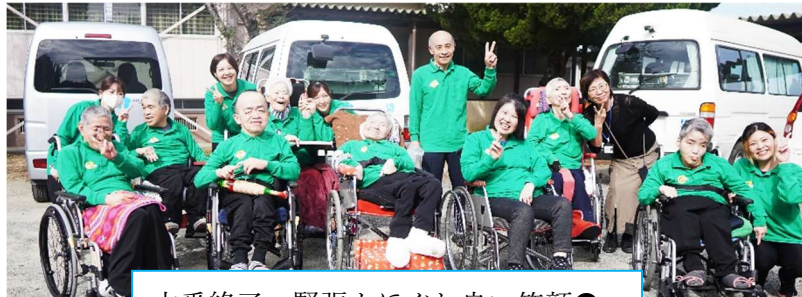
本番終了～緊張もほぐれ良い笑顔😊