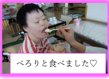
ぺろりと食べました♡