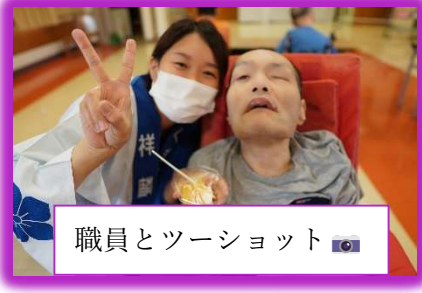
職員とツーショット📷