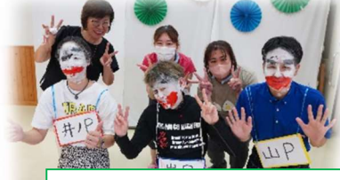
↑くまむた荘アイドルと かき氷早食い優勝者!!