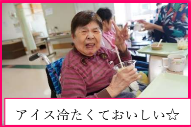
アイス冷たくておいしい☆