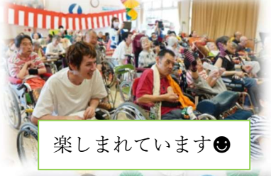
楽しまれています😊