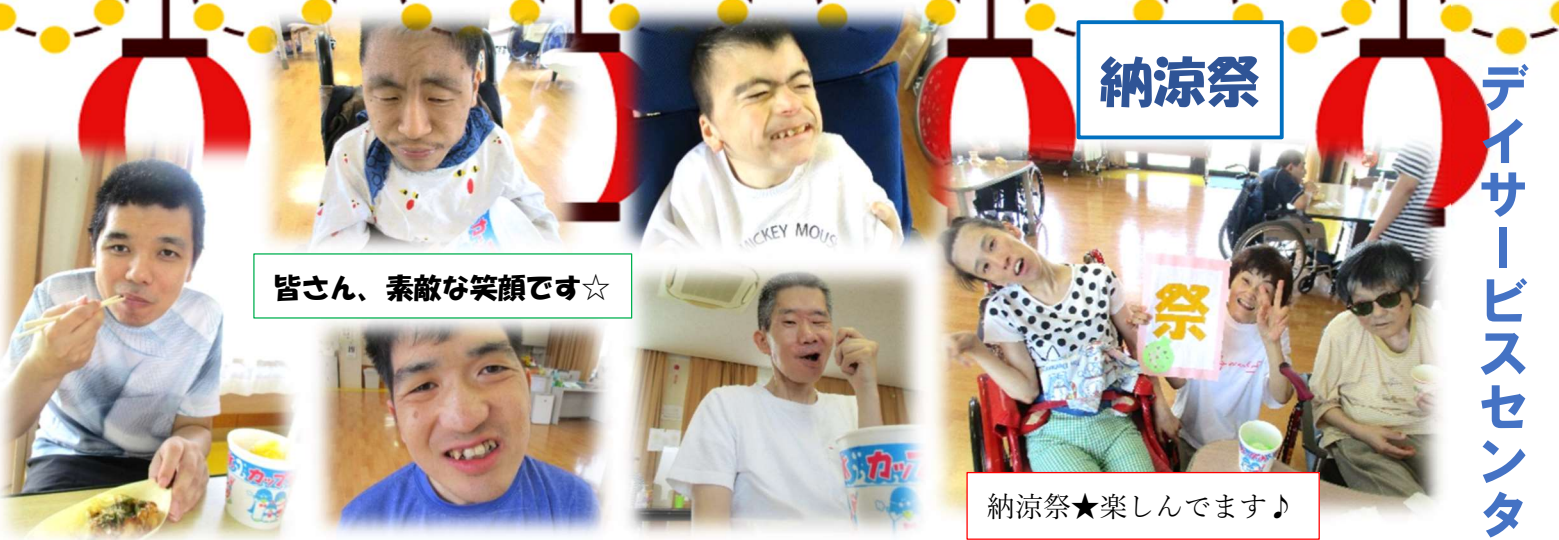
皆さん、素敵な笑顔です☆