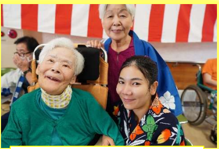
OGさんと技能実習生と♪