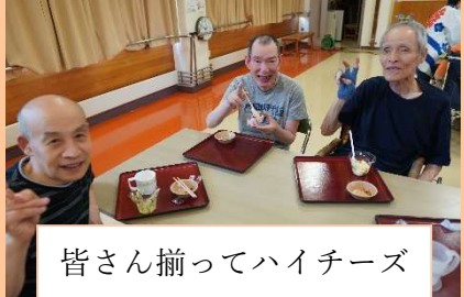
皆さん揃ってハイチーズ