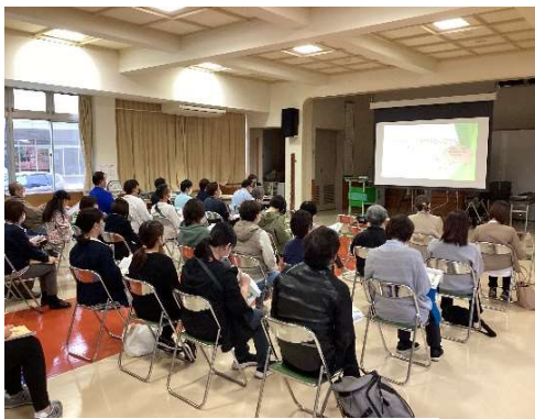
↑事業計画説明会の様子

施設長より当法人の今年度の事業計画と方向性が示された後、各部署長より、今年度取り組むべき部署内の行動計画について発表をし、全職員で共有しました。1年間、職員全員が同じベクトルで、各部署それぞれの計画達成を目指し、一丸となって取り組んでいきたいと思えます。今年度もよろしく願いいたします。