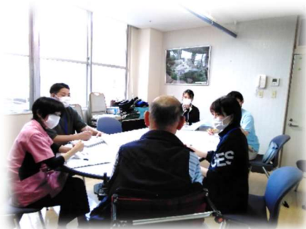
~担当者会議の様子~

早速、4月が計画作成月となるご利用者13名の会議を4日間にわたり開催しました。参加されたご利用者、ご家族より直接意見を伺い、また施設で提供している個別の健康管理、生活支援、給食、リハビリの各分野の支援状況、課題等を報告、共有しました。1ケースあたり20分程度と限られた時間ではありますが、ご利用者の今年1年間の支援の方向性を確認する大事な機会として、今後も続けていきたいと思えます。