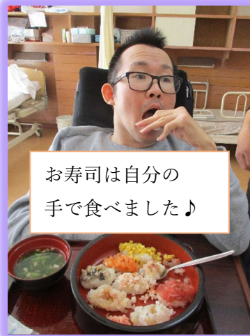
お寿司は自分の手で食べました♪