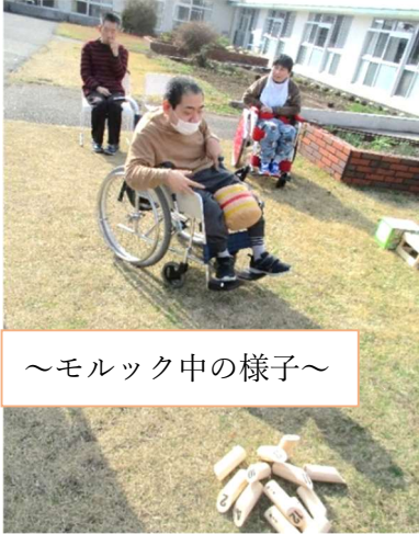
～モルック中の様子～

先日のポカポカ陽気の日に、中庭に出て、フィラード発祥のゲーム「モルック」を行いました。ボーリングのように並べた木片めがけて木の棒を投げて倒すゲームで、正式にはポイントが50点ピッタリになった方が勝ちというルールだそうです。皆さん楽しんで参加されましたよ！ その後は春探しの散策へ。「菜の花が咲いている」「梅の花が咲きだした」と、皆さんと一緒に、季節の移り変わりを肌で感じました。まだまだ、寒い日もあります。春はそこまで来ています。