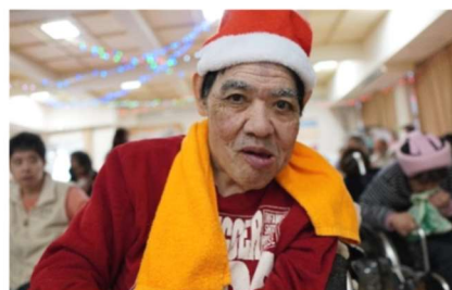
大 田 様