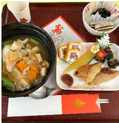
昼食 お雑煮とお屠蘇料理！

お正月はおせち料理を提供しました。元日の昼食はお雑煮と屠蘇料理、夕食はおせち料理を仕出し用お弁当箱に詰めて提供しました。また料理の内容や器を例年と少し変えており、作る側も新鮮でした。そしてお雑煮についても、今回新調した黒塗りにラメが入った高級感あふれる大きなお椀に、沢山の具材とお餅を入れ、おいしい出汁で提供いたしました。今年も笑顔あふれる食事タイムを目指していきます。