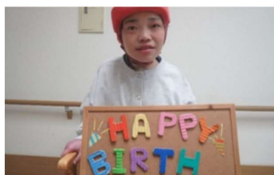
有 働 様