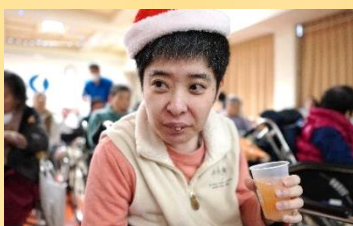
ノンアルコールのお味は～！？