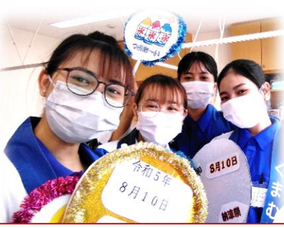
技能実習生2期生と一緒に♪ (左二人)