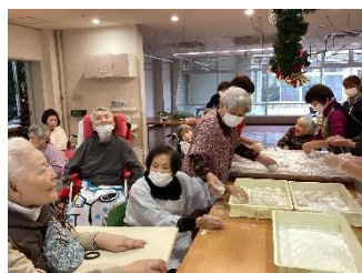
OGの方達と 久々の再会→ 「元気だった ね？」♪