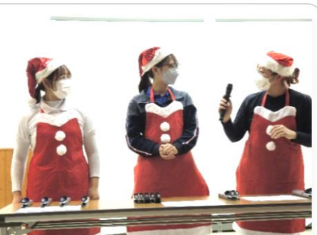
クリスマス会での一コマ (左二人)