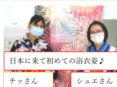
日本に来て初めての浴衣姿♪