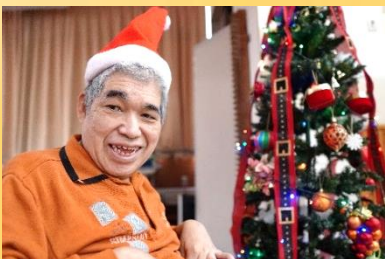
クリスマスツリーと一緒に♪