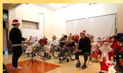
～音楽クラブの演奏の様子～