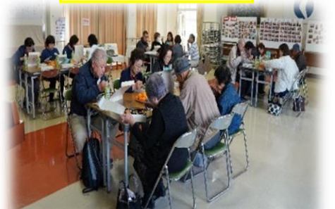
グループに分かれての交流会