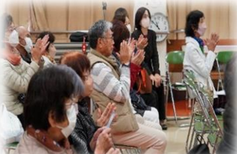
ご家族から拍手喝采