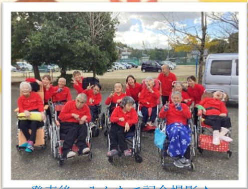
発表後、みんなで記念撮影♪