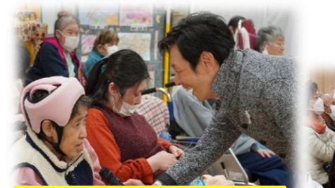
たけしさんから ご利用者へのインタビュー