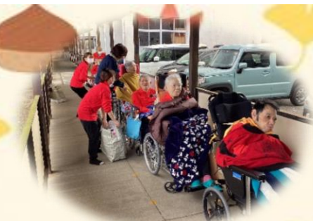
↑発表前の廊下にて待機中!!

ご利用者からは「緊張したけど、演奏がいつも通り出来て良かった」「緊張はしなかったけど4年生と会えて元気が出た」等の声が聞かれました。