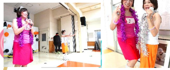
くまむた荘のミイちゃん・ケイちゃん♡