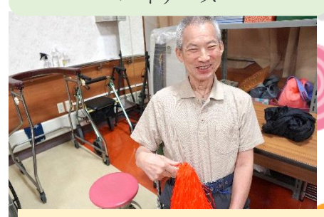
～職員出し物の応援中!!!～