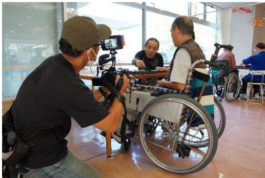
オセロをしている様子