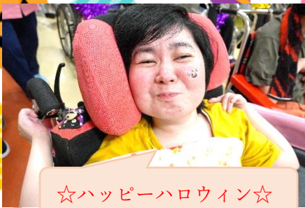
☆ハッピーハロウィン☆

ここ数年、新型コロナの影響で、中々ご利用者の皆さんを集めての催し物が出ない状況が続いていましたので、ご利用者から「久々に楽しかった!!」「ケーキも美味しかった♪」等の言葉が聞かれました。