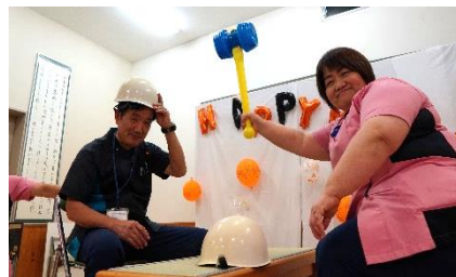
被って叩いてじゃんけんポン