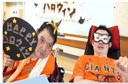
ジャイアンツユニホームでピース