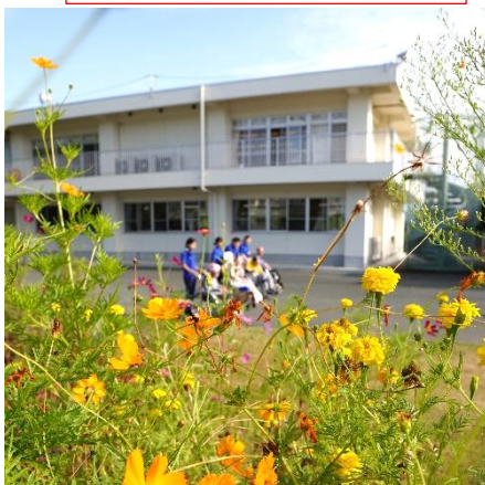
ドローンを使ってご利用者と散策 をしている様子を撮影!