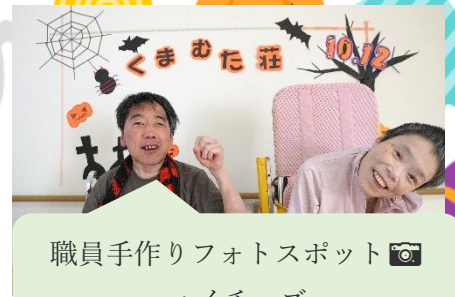
職員手作りフォトスポット ～ハイチーズ～