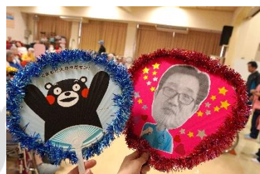
医務室出し物の応援グッズ!!