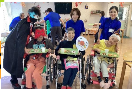
ケーキバイキング