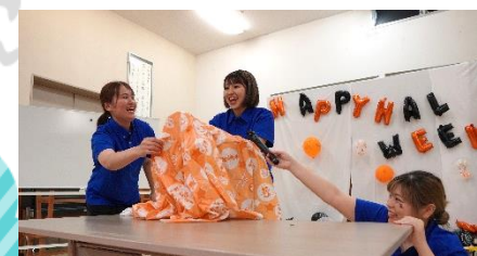
給食室の出し物☆ 手品編