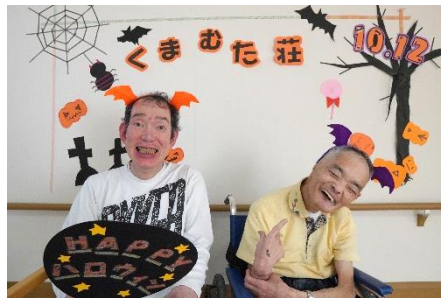
笑顔がステキですネ!!!