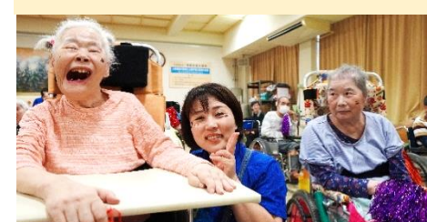
顔にペイントシール貼りました♪