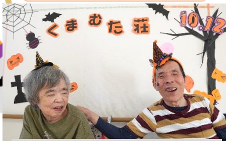
☆トリックオアトリート☆