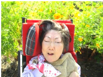
宮崎様 17日 おめでとうございます★