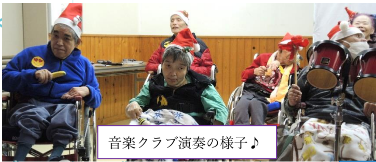
音楽クラブ演奏の様子♪