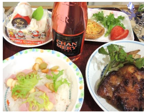
大きいケーキ食べるぞ～