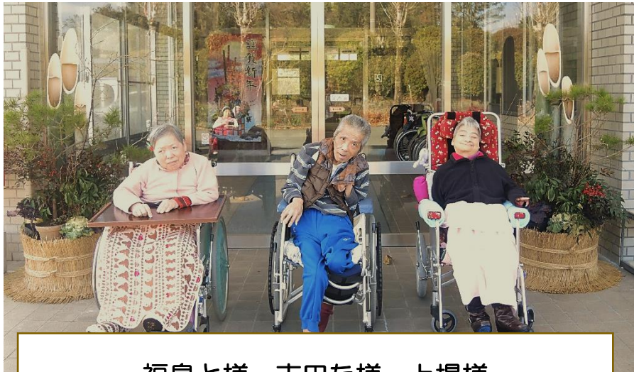
福島と様 吉田た様 上場様