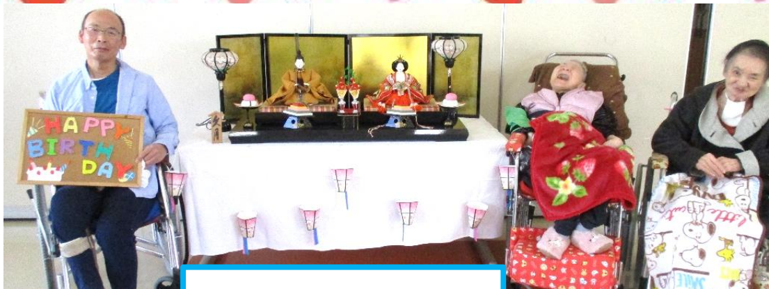
山内様 釜賀様 上村様