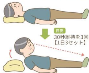
頭部挙上訓練 (シャキア・エクササイズ) ～咽頭の筋力を鍛える～