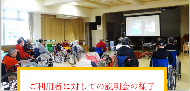
ご利用者に対しての説明会の様子

現在、実習生は職員指導のもとご利用者の日常生活支援の研修中ですが、意欲的に一生懸命取り組まれています。ご利用者、ご家族の皆様、これから3年間どうぞよろしくお願いいたします。実習生の自己紹介については来月号に掲載します。