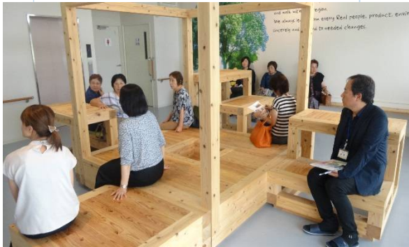
↑誰もが立ち寄れる交流スペースにてひと休み

9月27日家族会研修として、玉名市にある「地域福祉交流館ファインディングR」の施設見学に出掛けました。今年4月に開設された事業所で、一つの建物の中で、障害者の相談支援、就労支援、児童発達支援、こどもの居場所づくり、NPO支援センター等多数の事業に取り組まれている施設でした。同じ建物内で複数の事業を行うことで、ご利用される方が刺激を受け合い良い効果が生まれるとのことでした。また地域に溶け込み、自然と立ち寄りたくなる環境づくりにも力を入れておられました。就労支援事業所「風工房R」にていただいた、淹れたてのコーヒーは格別でした！ぜひ玉名市にお出かけの際は、ふらっとコーヒーを飲み立ち寄られてみてはいかがでしょうか？次の家族会行事としては、11月23日（土）に講演会・交流会を予定しています。多数のご家族の皆様のご参加お待ちしております！