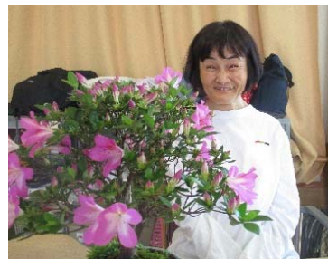
藤枝 様 6月8日生