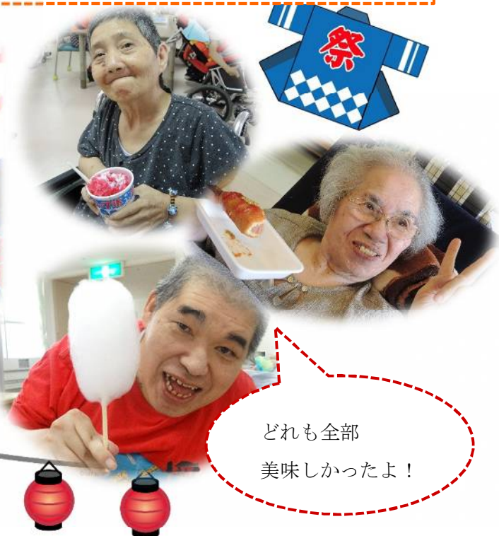
どれも全部 美味しかったよ！