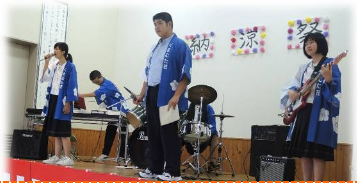
甲佐高校によるバンド演奏☆カッコいいですね(*^_^*)