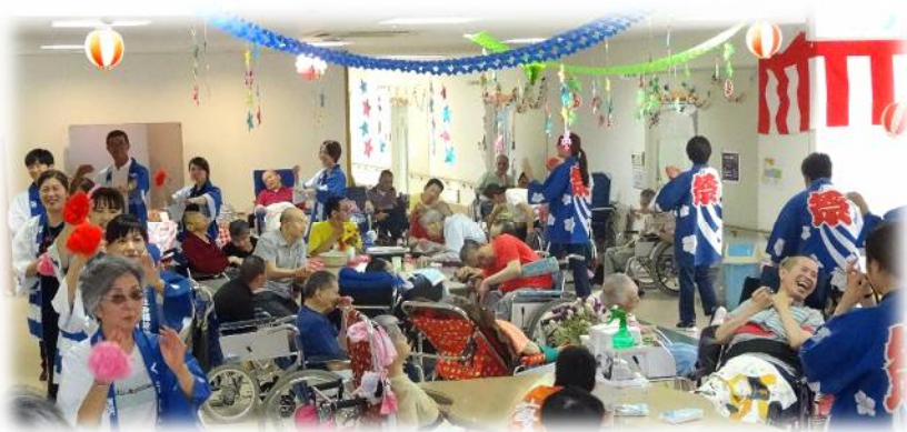
職員による『城南音頭』 お揃いの花を手につけて踊りました♪