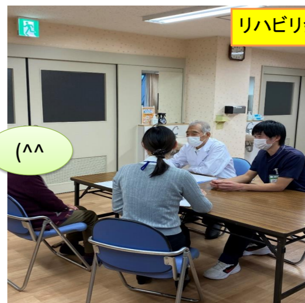
リハビリ会議の様子