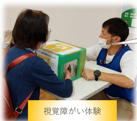
視覚障がい体験 シャンプーはどっち？